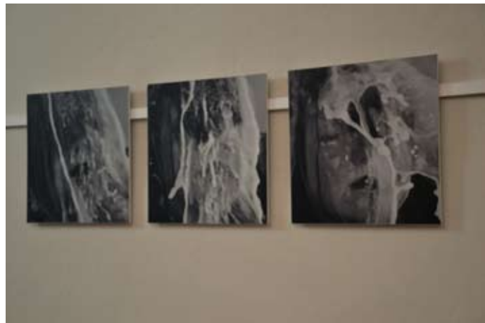
Sarah Link [o.T., aus der Reihe „lisa“] 2010 Fotodruck auf Hartschaum je 30 x 30 cm