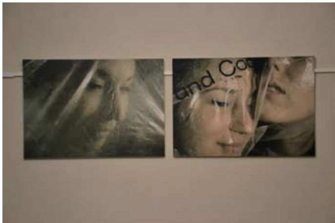
Sarah Link plastikgesicht | verpackung 2010 Fotodruck auf Hartschaum je 59,4 x 84,1 cm