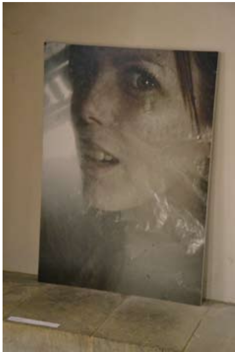
Sarah Link verpackung2 2010 Fotodruck auf Hartschaum 84,1 x 59,4 cm