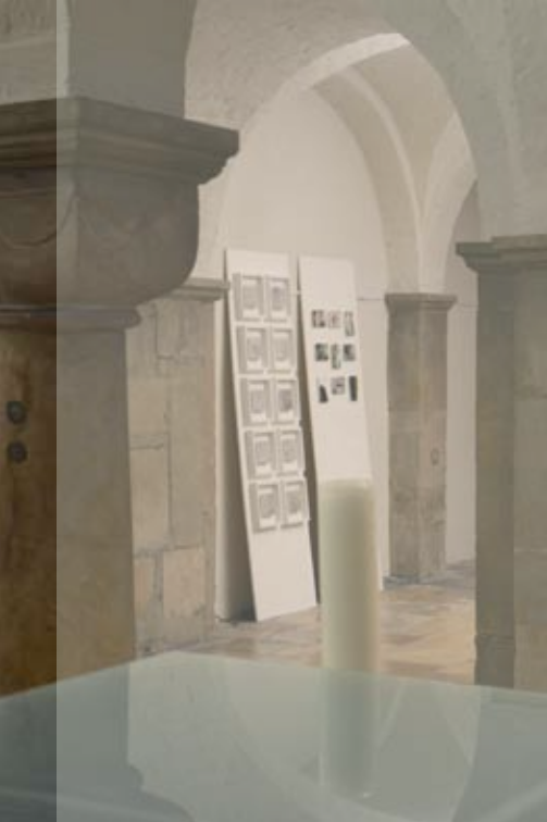
Simi Larisch edition St. Vitus (10 Exemplare): Wachs (Paraffin) auf Holz + Zeitungsseiten je 12 x 12 cm (Rahmen 25 x 25 cm)