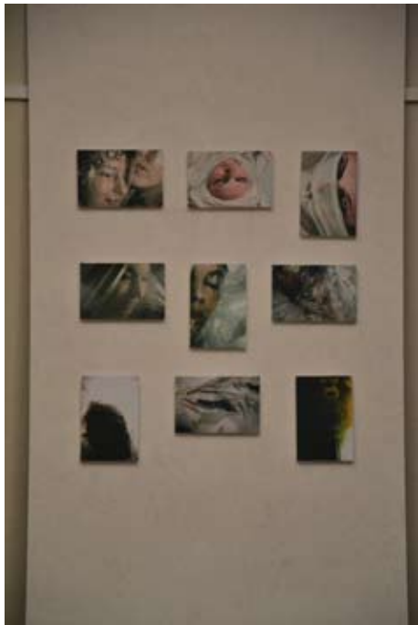
Sarah Link Edition (9 Exemplare): verschiedene Motive Fotodruck auf Hartschaum ca. 10 x 15 cm