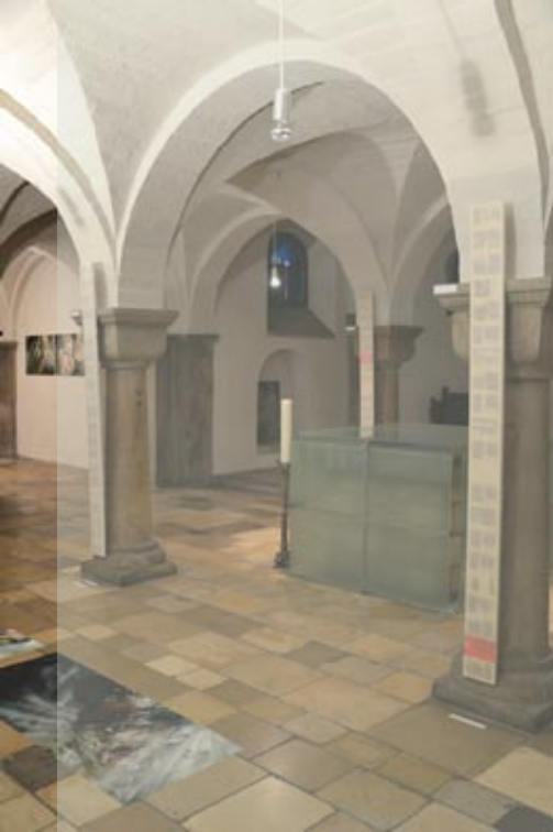
Simi Larisch ovid_metamorphoses 2012 Wachs (Paraffin) auf Holz + Buchseiten 3 Stelen à 14,5 cm x 199,5 cm