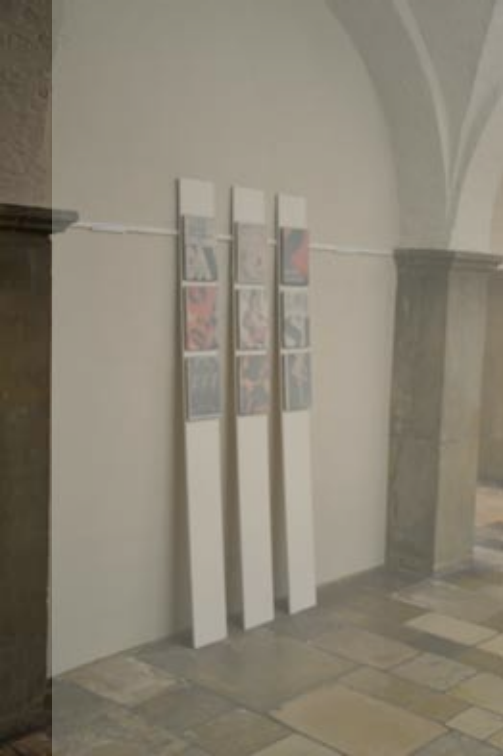
Simi Larisch vogue_testino 2010 Wachs (Paraffin) auf Holz + Magazinseiten je 27,5 x 20 cm (9 von 20 Teilen)